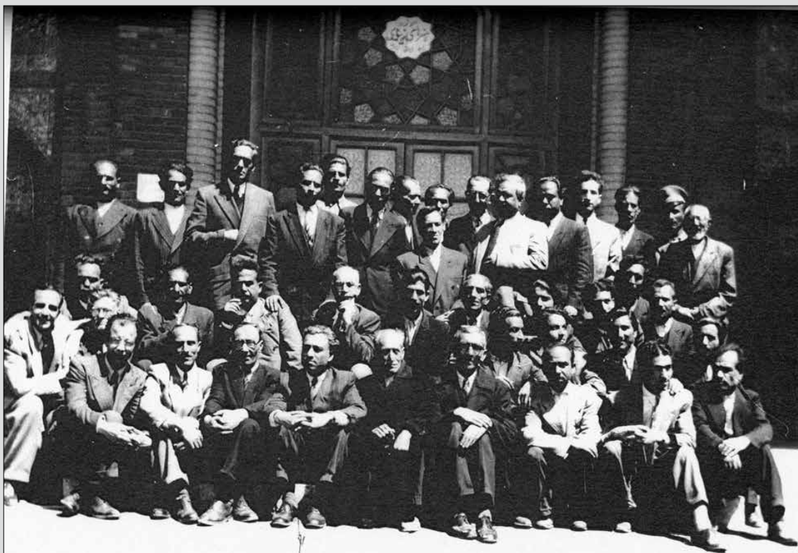
جمعی از هنرمندان مدرسه صنایع قدیمه

حذف ابعاد هنری به «دفتر پژوهش و آفرینش»، تغییر نام یافت.