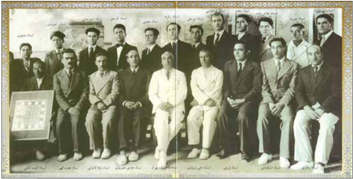
جمعی از هنرمندان مدرسه صنایع قدیمه