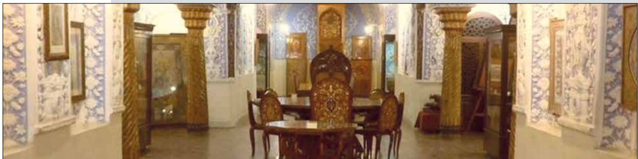
نمونه آثار (میز و صندلی معرق و منبت و تابلوهای مینیاتور و تذهیب بر روی دیوارها) اساتید مدرسه صنایع قدیمه که اکنون در موزه هنرهای ملی (حوض‌خانه باغ نگارستان) نگهداری می‌شوند.