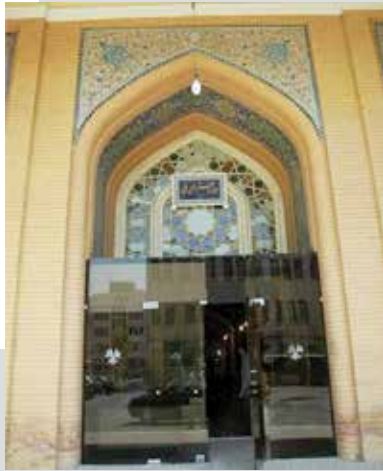
تصویر امروزی از موزه هنرهای ملی که در گذشته مدرسه صنایع قدیمه بوده است و در عکس قبلی با عنوان موزه هنرهای زیبا در پشت سر اساتید مدرسه صنایع قدیمه مشخص است.