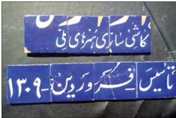
بخشی از کاشی سردر کارگاه‌های مدرسه صنایع قدیمه